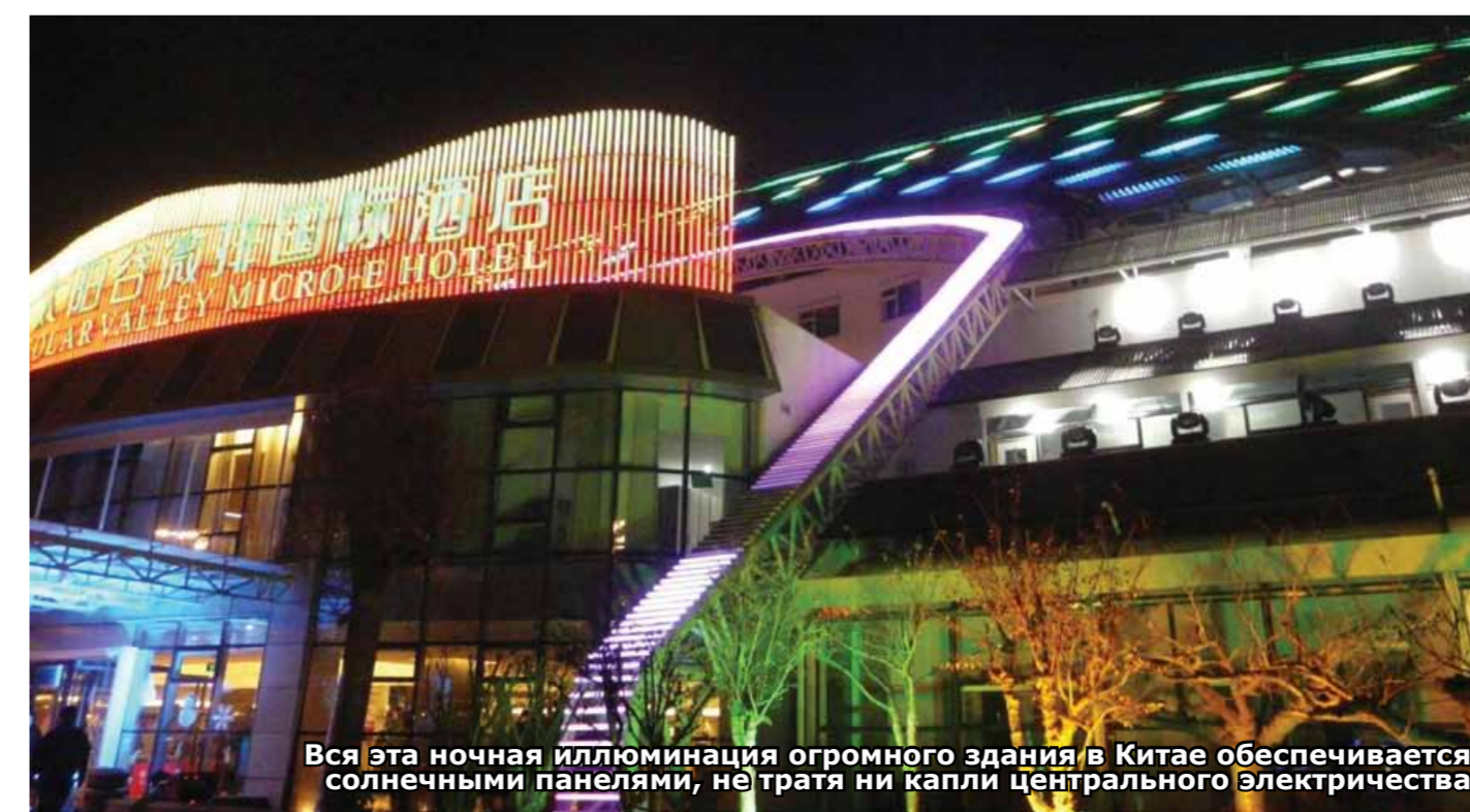
Вся эта ночная иллюминация огромного здания в Китае обеспечивается солнечными панелями, не тратя ни капли центрального электричества