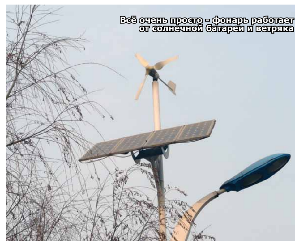
Всё очень просто - фонарь работает от солнечной батареи и ветряка