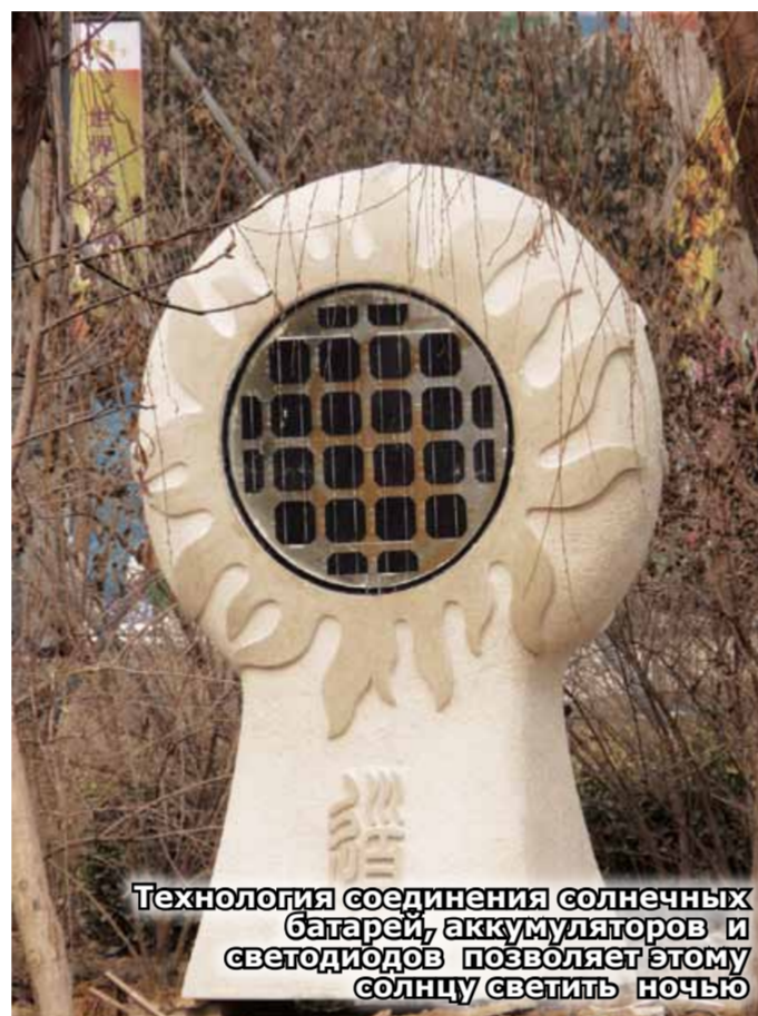
Технология соединения солнечных батарей, аккумуляторов и светодиодов позволяет этому солнцу светить ночью

Преобразование энергии в солнечных панелях основано на фотовольтаическом эффекте, который возникает в неоднородных полупроводниковых структурах при воздействии на них солнечного излучения. Этот эффект был открыт в 1839 году молодым французским физиком Эдмондом Беккерелем.