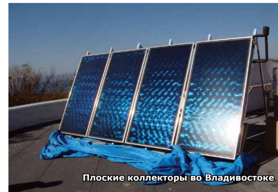
Плоские коллекторы во Владивостоке