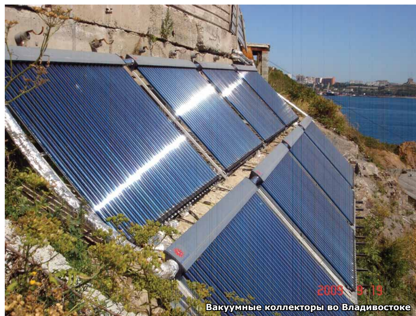
Вакуумные коллекторы во Владивостоке

Основной плюс плоских коллекторов то, что с точки зрения обслуживания - это абсолютно бесперебойное оборудование. Плоские коллекторы хорошо подходят для влажного климата Приморского края. Лучше вакуумных работают в пасмурную погоду. И это перевешивает то, что коэффициент полезного действия у них чуть ниже, чем у вакуумных. На рынке в Приморье представлены европейские и китайские модели, позволяющие оборудовать по настоящему теплоэффективные здания.