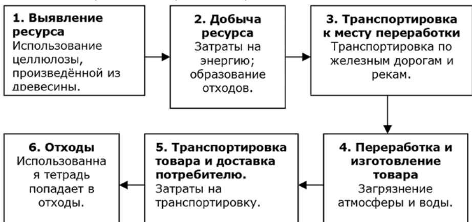
Рис. 2. «Жизненный цикл» школьной тетради (Ягодин Г.А. и др, «Экология Москвы и устойчивое развитие»)

териальных и энергетических затрат. Процесс её изготовления наносит вред окружающей среде. В связи с этим важную роль играет её переработка и вторичное использование. Поэтому предлагаем выполнить практическую работу по переработке газетной бумаги.